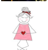
Yoga im Himmel & Ääd