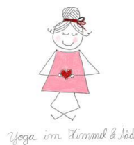
Yoga im Himmel & Ääd

Alle Kurse im Kath. Familienzentrum, Altenberger-Dom-Str. 136 (hinter der Hetz Jesu Kirche)